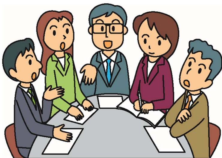
消費者庁イラスト集より

近年 成年後見制度や日常生活自立支援事業等 消費者保護に関する様々な法整備がなされている